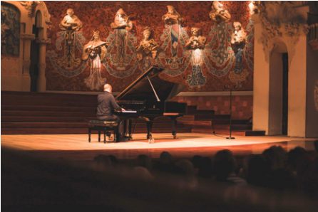
BARCELONA Palau de la Música