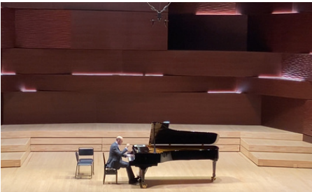
TOKYO Tokyo College of Music