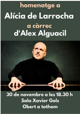
TARRAGONA Sala Xavier Gols