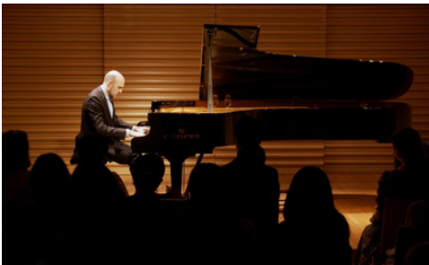
TOKYO Bechtsein Centrum