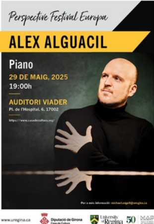
GIRONA Auditori Viader